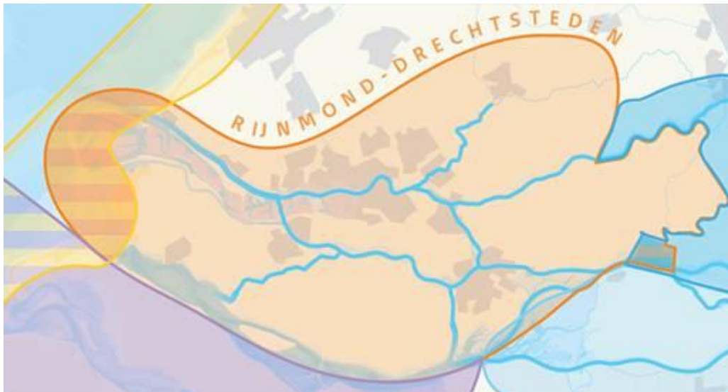
Figuur 3: werkgebied deltaprogramma Rijnmond-Drechtsteden