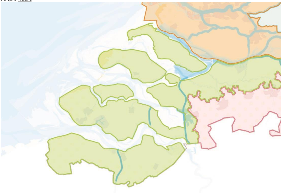
Figuur 2: kaart met begrenzing van het Deltaprogramma Zuidwestelijke Delta