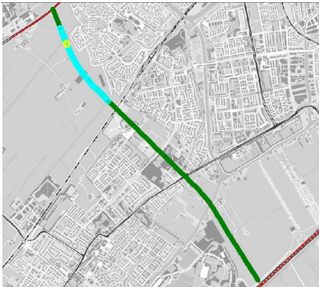
Figuur 3.3 Kilometer met het hoogste groepsrisico (blauw) op de nieuwe verbindingsweg tussen de A4-A44