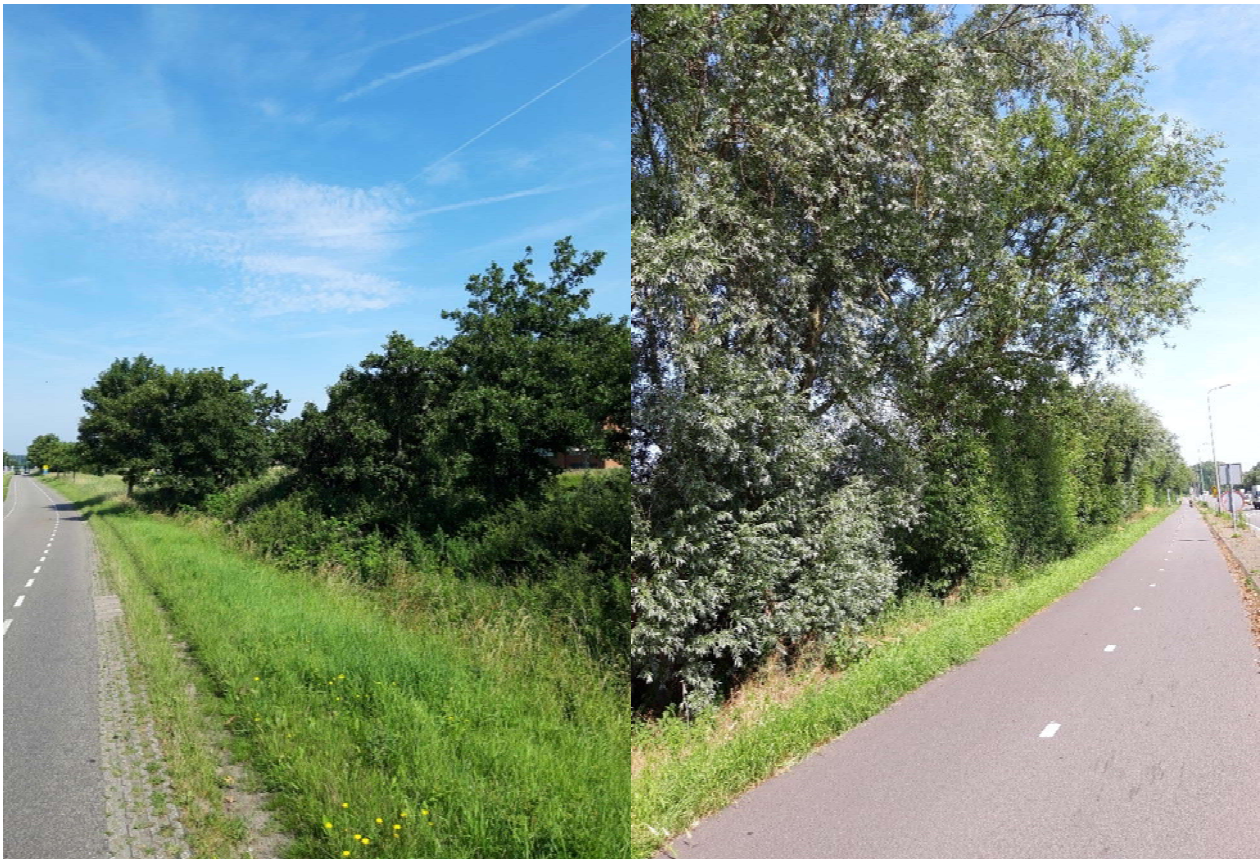
Figuur 3-6. Foto gemaakt aan de Koolduinweg.