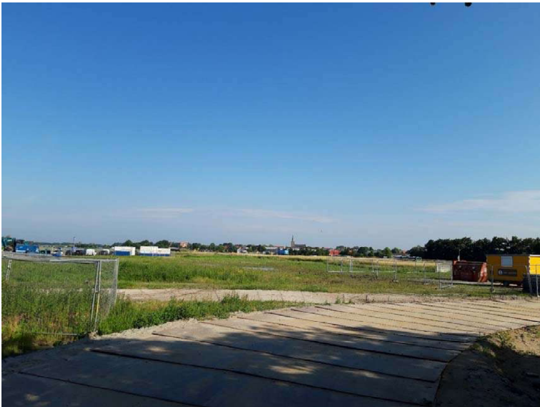
Figuur 4-5. Bouwterrein ter hoogte van de achterweg met mogelijk geschikt habitat voor rugstreeppad.