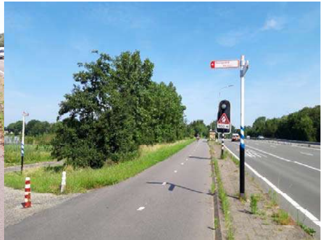
Figuur 4-2. Bomenrij langs de N206 ter hoogte van de Zanderij.