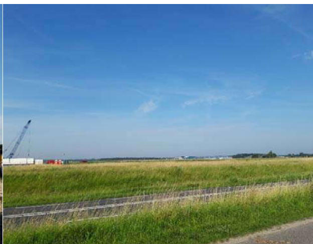
Figuur 3-3. Foto gemaakt aan de achterweg.