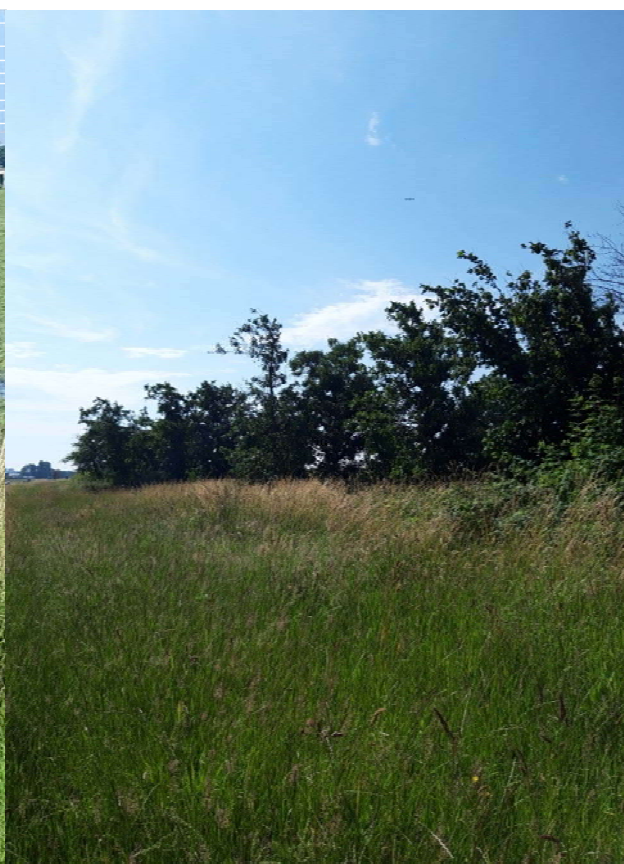
Figuur 3-5. Foto gemaakt onder Achterweg viaduct.