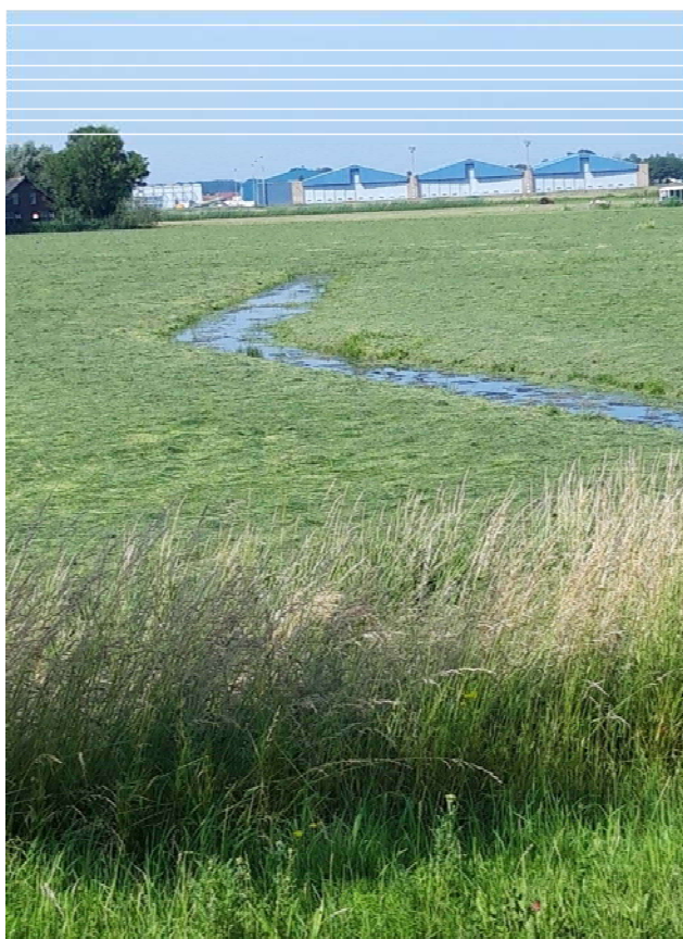
Figuur 3-4. Foto gemaakt aan de Kooltuinweg.