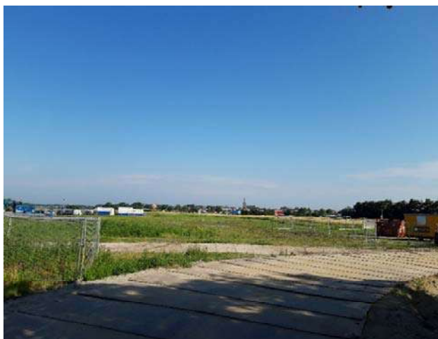
Figuur 3-2. Foto gemaakt aan de achterweg.