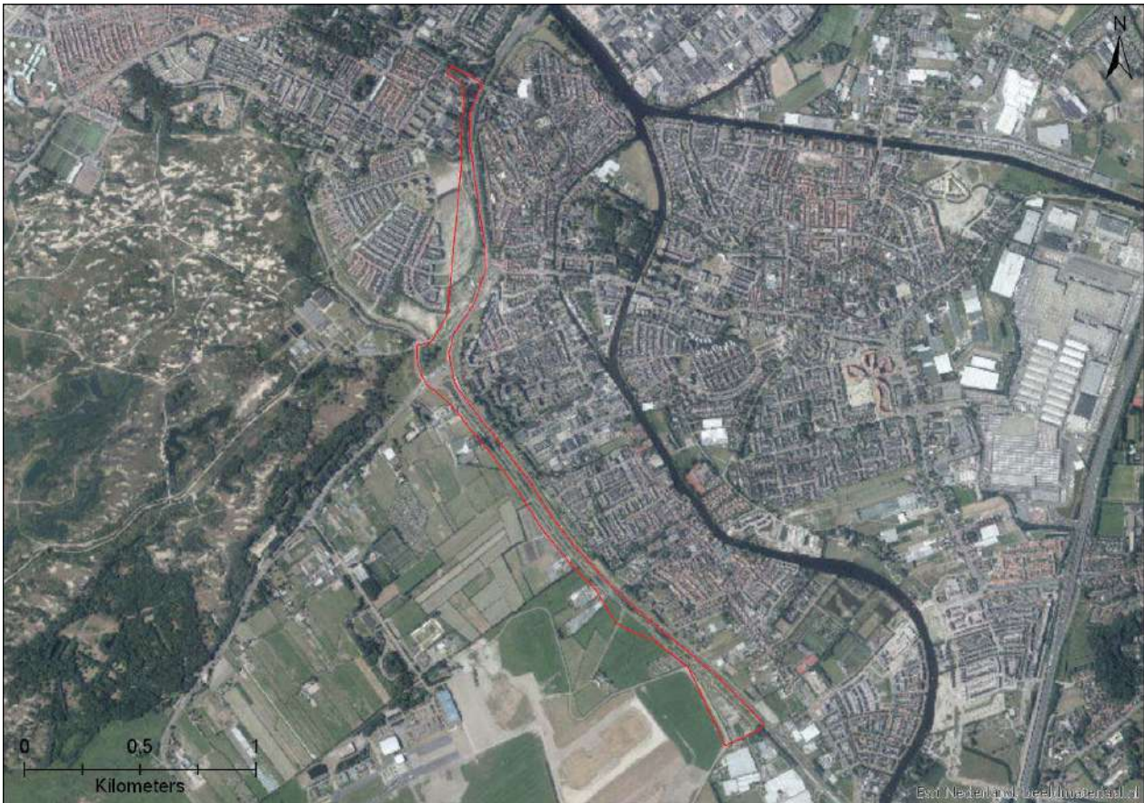
Figuur 3-1. Ligging van het plangebied aangegeven met rode lijn.

De provincie Zuid-Holland is voornemens een busbaan aan te leggen naast de N206 tussen Leiden en Katwijk (Figuur 3-1). In het westen van de weg is vooral bebouwing. In het oosten van de weg ligt vooral agrarisch landschap. Ook Natura 2000-gebied Meijndel & Berkheide ligt oostelijk van de N206. Het plangebied bestaat met name uit agrarisch grasland. Ook bevinden zich er verscheidene watergangen. Figuur 3-2 Figuur 3-8 geven een impressie weer van het plangebied.