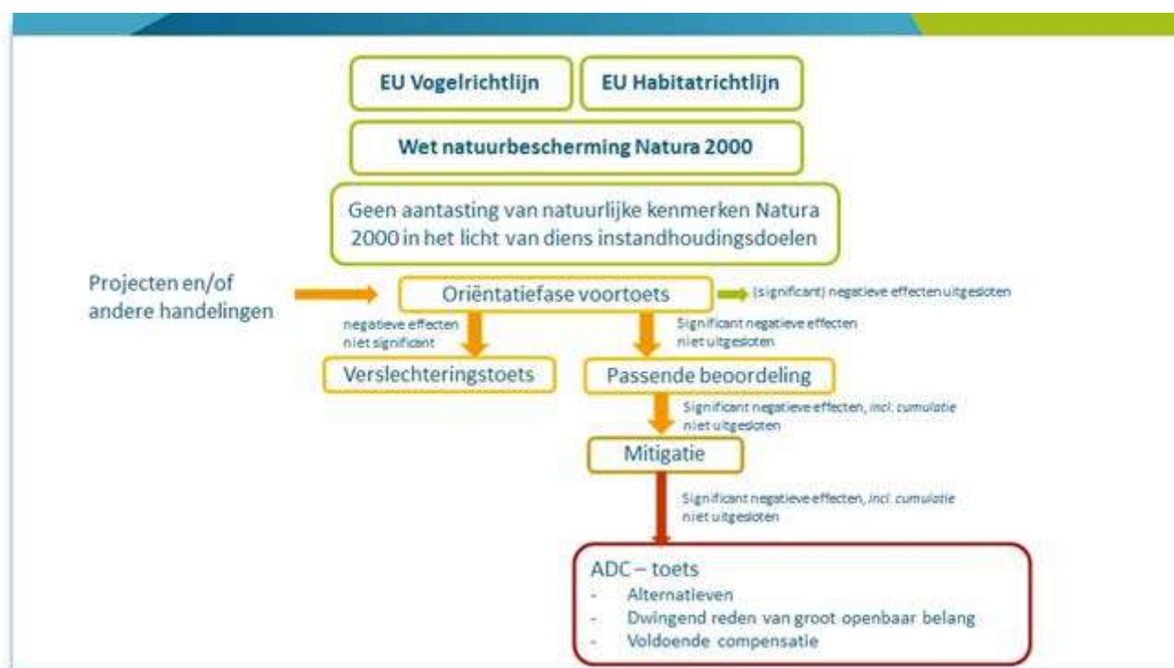
Figuur 2-1. Schematische weergave van de toetsing van projecten aan Natura 2000-doelen

Projecten of handelingen die negatieve effecten kunnen hebben op Natura 2000-gebieden en bijbehorende instandhoudingsdoelen zijn conform artikel 2.7 van de Wnb in beginsel niet toegestaan. Een voortoets in de oriëntatiefase kan uitsluitel geven of het plan geen negatieve effecten heeft (geen vervolg) of dat er een verslecheringstoets of passende beoordeling vereist is (Figuur 2-1).