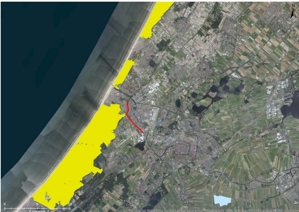
Figuur 5-1. Ligging van Natura 2000-gebieden ten opzichte van het plangebied. Bovenste gele gebied: Kennemerland-Zuid; middelste gele gebied: Coepelduynen; onderste gele gebied: Meijendel & Berkheide; blauwe gebied: De Wilck; rode lijn: plangebied.

Het plangebied maakt geen deel uit van een Natura 2000-gebied (Figuur 5-1). In de directe omgeving komen echter wel Natura 2000-gebieden. Natura 2000-gebieden die voorkomen in de omgeving van het plangebied en gevoelig zijn voor stikstofdepositie zijn Meijendel & Berkheide (100 m van plangebied), Coepelduynen (2,7 km van plangebied) en Kennemerland-Zuid (10 km van plangebied). Op dit moment worden de berekeningen hiervoor uitgevoerd. Daarnaast komt op 13 km afstand van het plangebied Natura 2000-gebied De Wilck voor. Dit gebied is niet gevoelig voor stikstofdepositie.