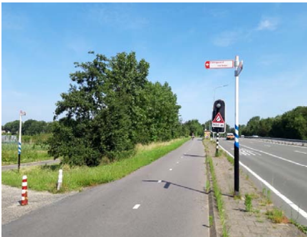
Figuur 3-8. Foto gemaakt ter hoogte van de Zanderij.