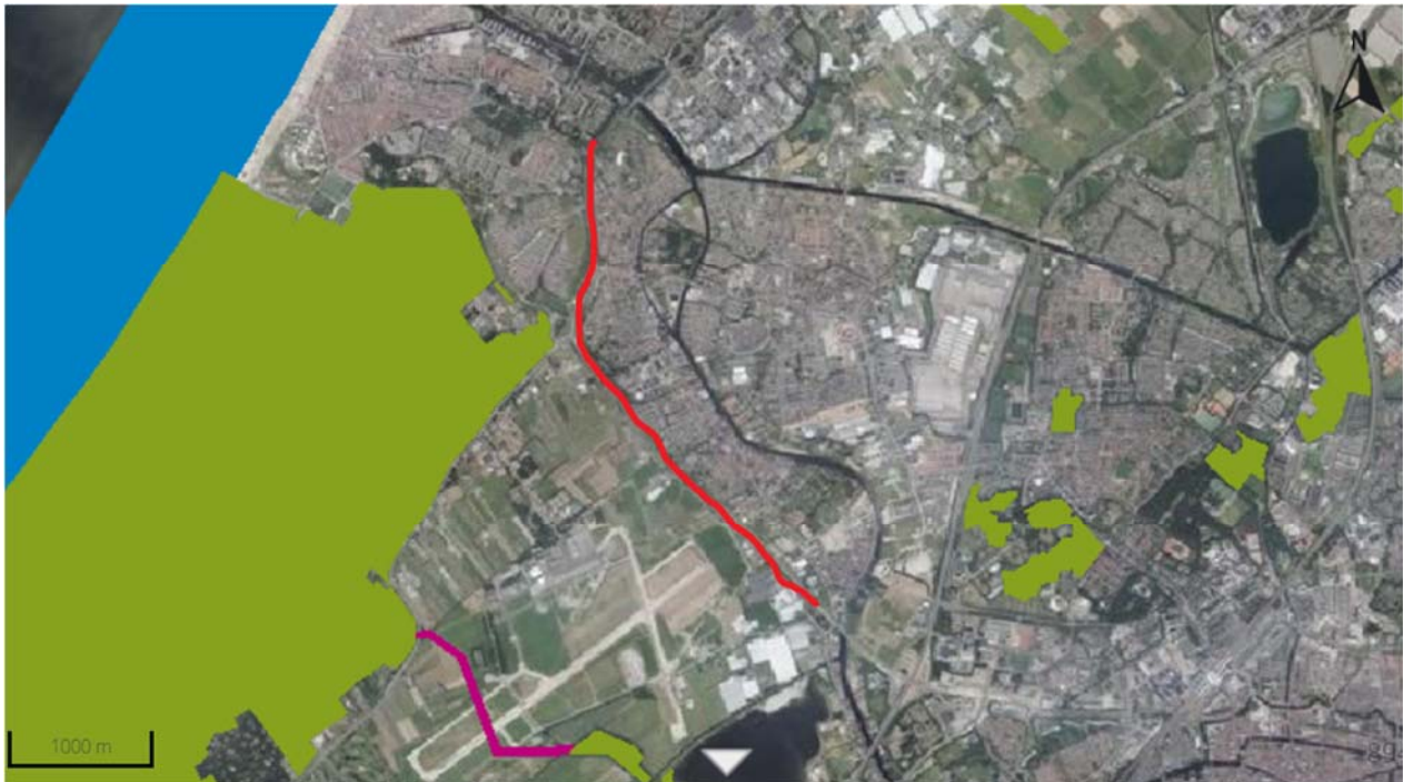
Figuur 5-2. Ligging van het plangebied ten opzichte van het NNN. Rode lijn: plangebied, overige kleuren: NNN.