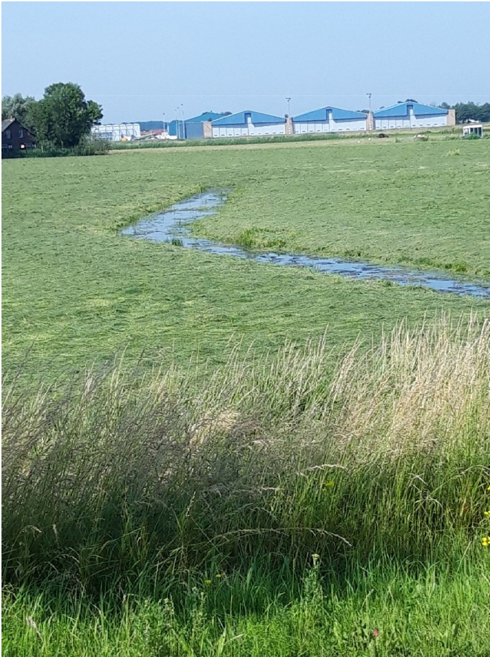
Figuur 4-6. Sloot aan de Kooltuinweg met mogelijk geschikt habitat voor rugstreeppadden.

Conclusie: In het plangebied komen mogelijk rugstreeppadden voor. Een overtreding van verbodsbepalingen ten aanzien van amfibieën kan daarom niet op voorhand worden uitgesloten.