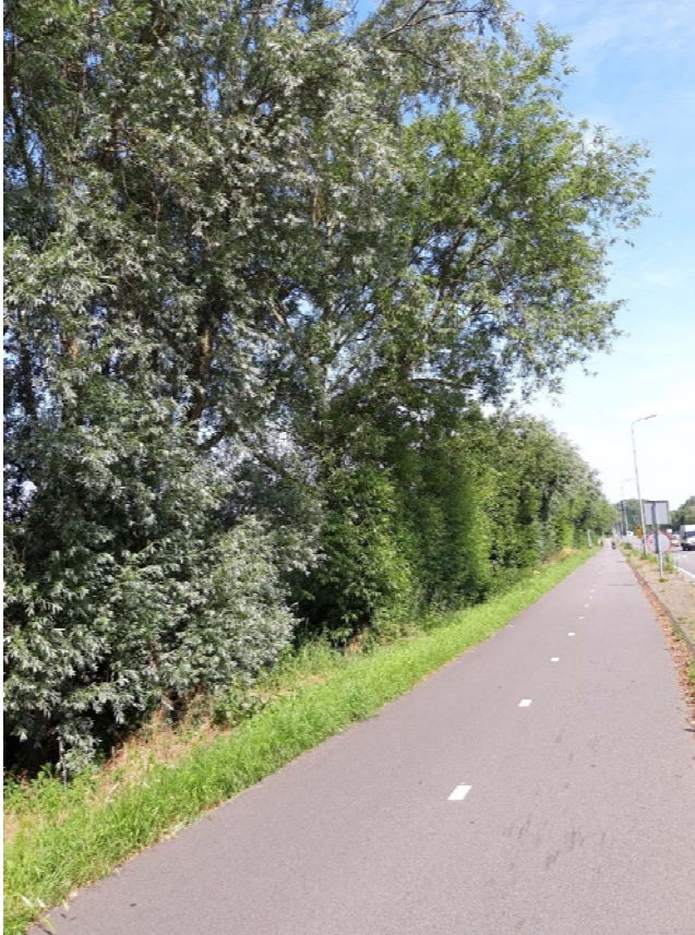
Figuur 4-1. Bomenrij langs de N206 ter hoogte van de Zanderij

de Zeeweg zijn holtes waargenomen die mogelijk geschikt zijn voor vleermuizen. Deze bomen zullen in het voornemen blijven staan.